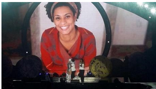
Figura 1 – Show da Katy Perry

18/03, às 23:14hs: “Katy Perry homenageia agora Marielle Franco em seu show no Rio. As milhares pessoas presentes gritam emocionadas com sua família: Marielle, Presente! #MarielleVive” (MARIELLE FRANCO, 2018a, n.p.) (FD4).