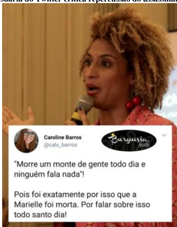
Figura 5 – Usuária do Twitter critica repercussão do assassinato de Marielle