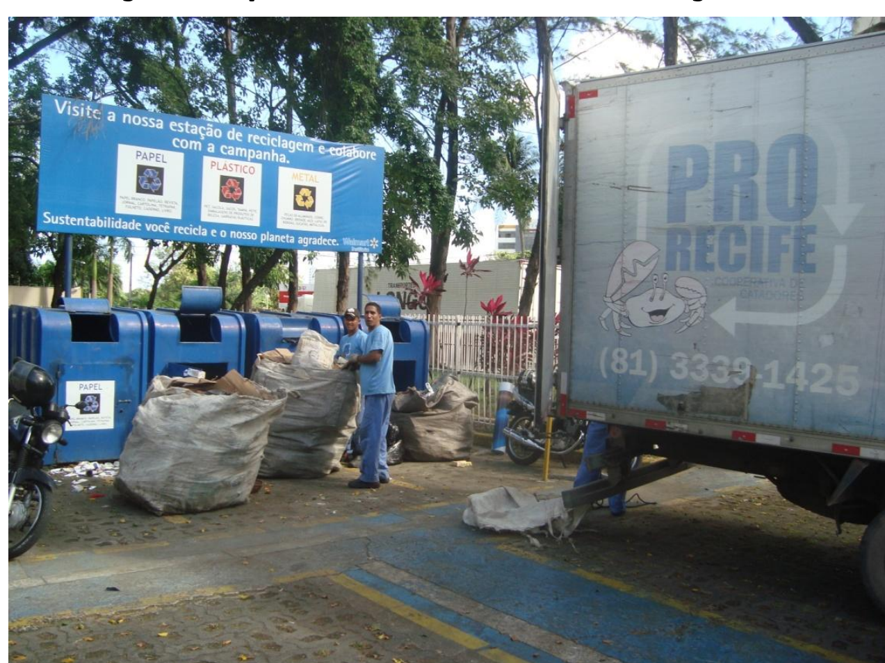
Figura 01: Cooperativa de catadores no momento da coleta na empresa

Na identificação da relação entre o Walmart Brasil e organizações do Terceiro Setor, são identificadas diferentes ações que envolvem esse relacionamento, fato este que também é observado no Hiper Bompreço, em Recife. Segundo informações dos entrevistados e observação, existem parcerias com cooperativas e outras instituições para melhor atuação no mercado (Figura 01):