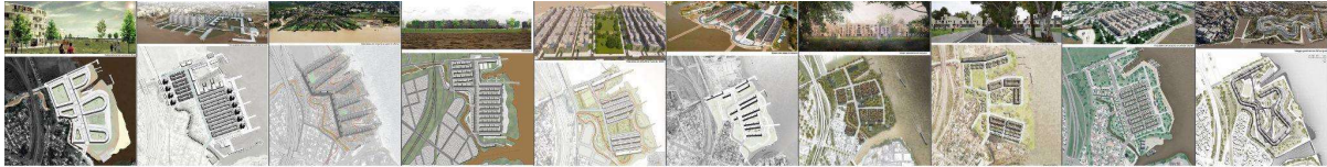
Figura 2: Proyectos de estudiantes de PFC considerados como UA del Proyecto de Investigación.