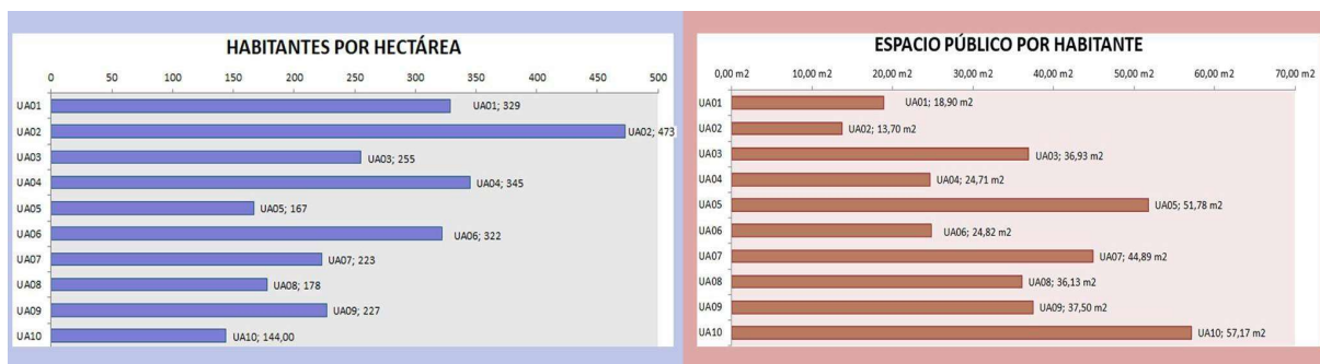
Figura 3: Diagramas comparativos de Indicadores de Calidad de vida Urbana: Tejido Residencial y Espacio Público en cada Unidad de Análisis.

Se presentan diagramas comparativos de los datos cuantitativos de TR y EP extraídos de cada UA (Figura 3).