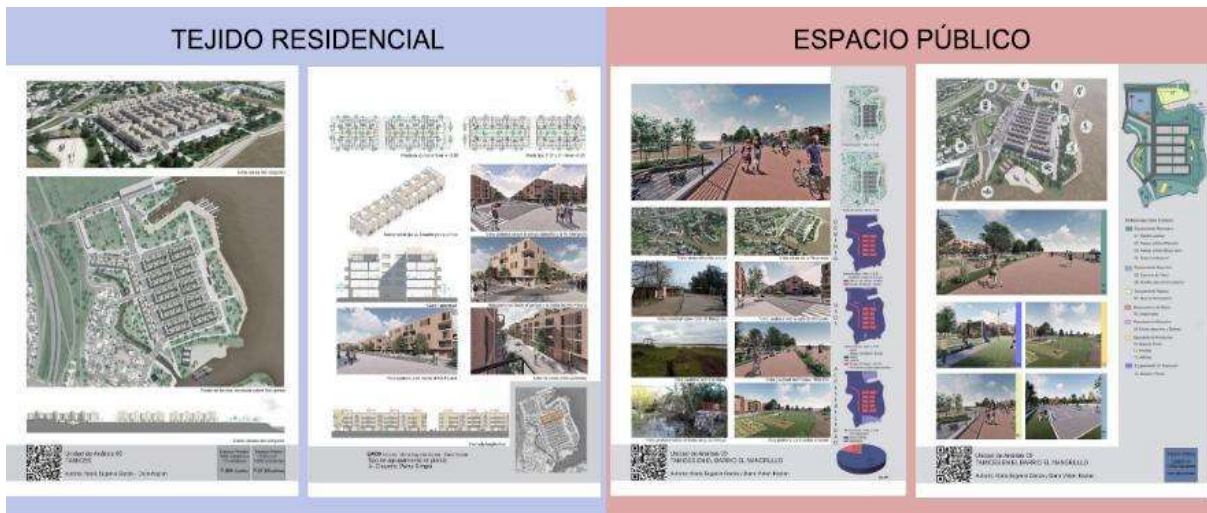
Figura 4: UA09. Autoras: María Eugenia García y Dana Kaplan.

Se producen fichas específicas de Tejido Residencial y Espacio Público para cada Unidad de Análisis. Se analiza críticamente el Tejido Residencial, su localización y disposición en la superficie común establecida para comparar los trabajos. Ambos aspectos inciden en la calidad del Espacio Público y en la conformación de la morfología urbana del sitio y el paisaje. Estas fichas sistematizan gráficamente los resultados de cada UA (Figura 4): por un lado, en relación al TR se registran los catastros proyectados, los diferentes agrupamientos de vivienda y sus tipologías. Por el otro, el análisis del EP proyectado y los usos específicos: equipamientos colectivos de orden productivo, educativo –formal e informal-, recreativo, deportivo, cultural o social.