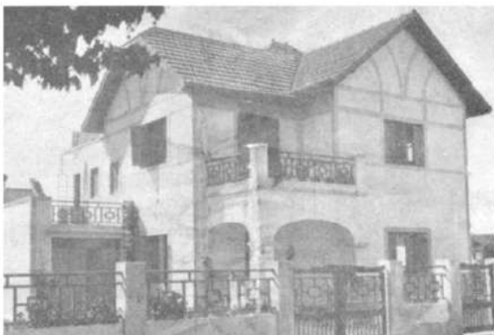
Figura 2: Transformación en residencia patrimonial ubicada en calle Cantilo y 8. Uso actual: punto gastronómico.

Si bien la categorización, se realizó de manera rigurosa, es importante destacar que muchas de las nuevas construcciones, se reformulan siguiendo los lineamientos patrimoniales, tales como: cubiertas a dos aguas, espacios de acceso con patios adelante, o molduras características de las casonas originales. Es decir, existe cierta intención por parte de los habitantes de no perder la historia y la identidad del sector mediante la representación de su arquitectura pero ahora conteniendo en sus interiores nuevos usos, que van de acuerdo a la impronta y demanda de esta centralidad característica de City Bell.