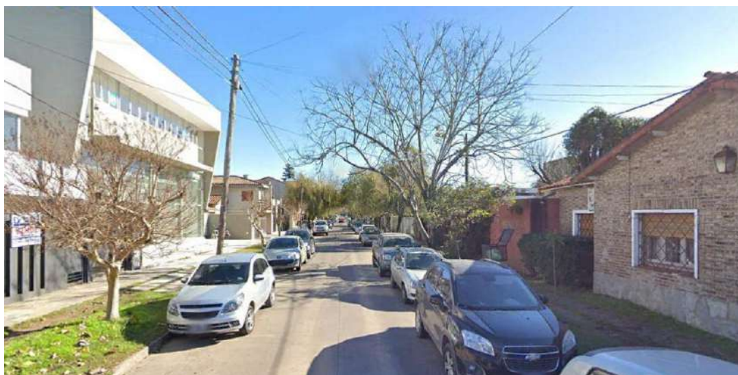
Figura 8: Calidad del espacio público media.