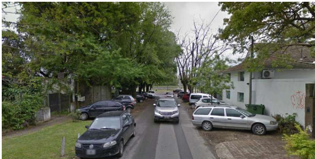
Figura 9: Calidad del espacio público baja.