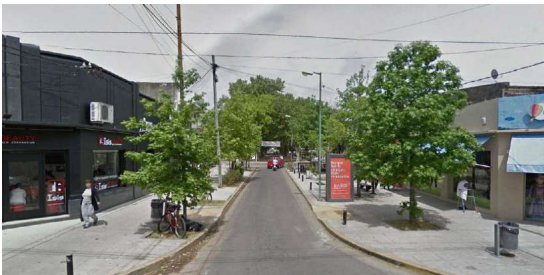
Figura 7: Calidad del espacio público alta.

movilidad reducida. Esto se hace evidente debido a que cuentan con amplios sectores en los que no existen veredas transitables e incluso se puede observar cómo los automóviles han invadido el espacio destinado a las mismas, librando los peatones a circular de manera más cómoda por la calle, con todos los riesgos que ello implica.