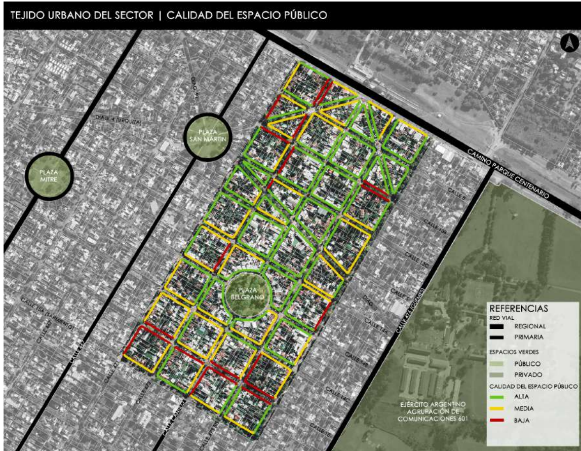
Figura 6: Plano de identificación de calidad del espacio público (FASE III).