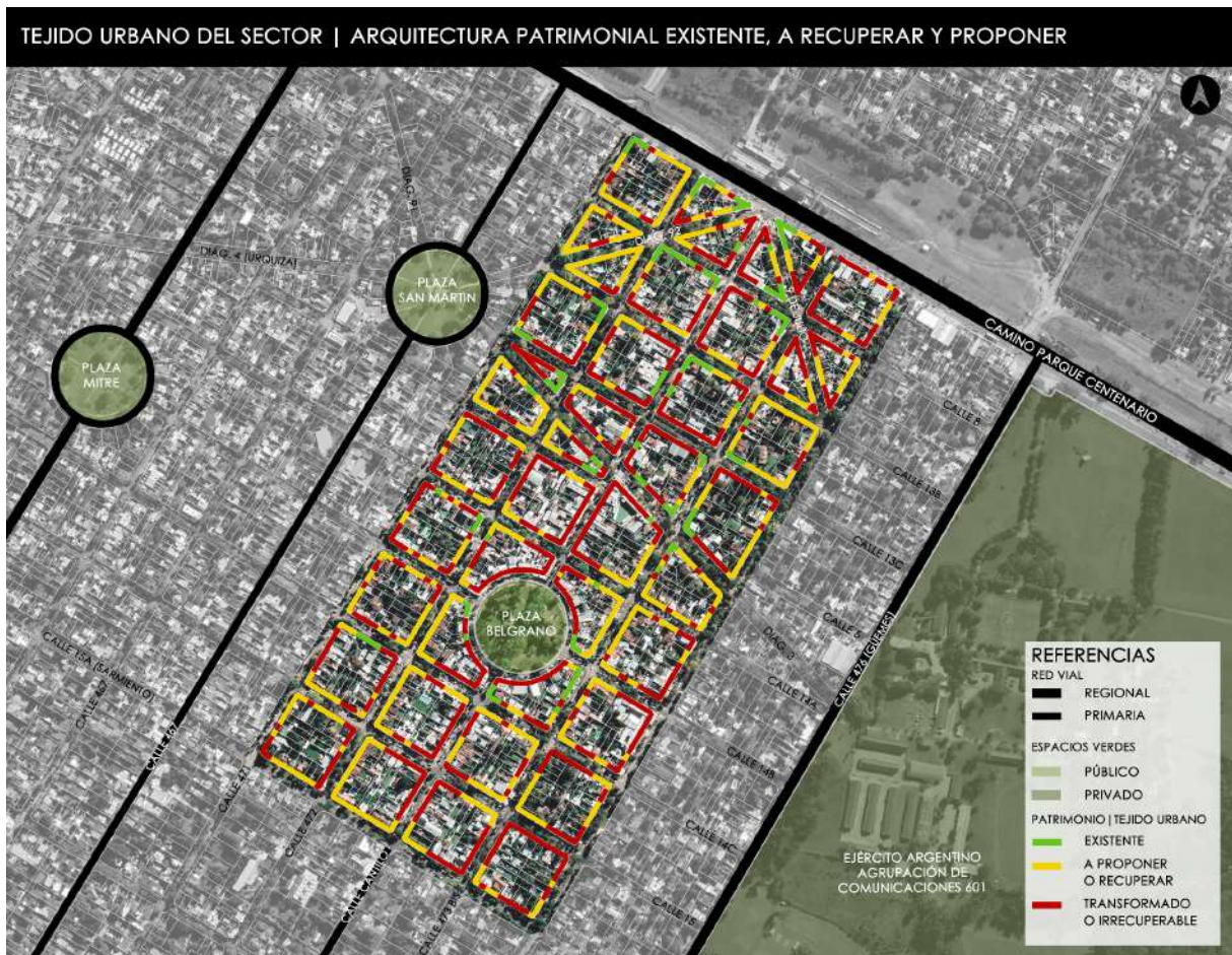
Figura 4: Plano de identificación de fachadas (FASE I).

Transformado / irrecuperable, aquellos bienes inmuebles que han sido transformados o reemplazados por nuevas edificaciones que rompen por completo con la identidad local. Tejido urbano sin ningún tipo de valor arquitectónico.