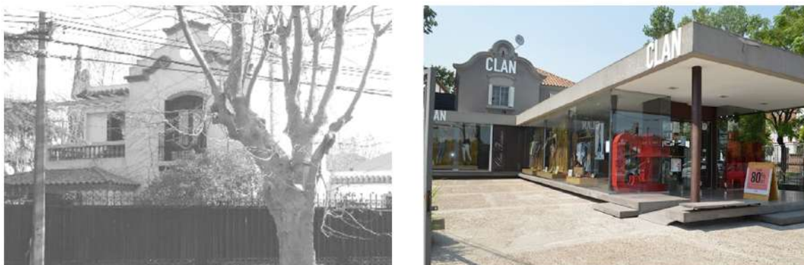
Figura 3: Transformación en residencia patrimonial ubicada en Diagonal 9 de Julio y Cantilo. Uso actual: local comercial.