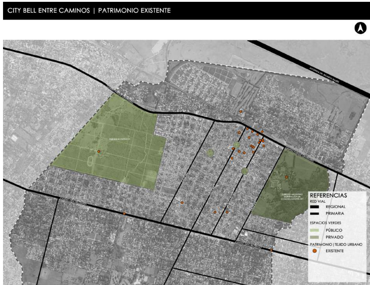
Figura 1: Mapeo de identificación del patrimonio existente.

particularidades urbanas y paisajísticas de la localidad, tal cual lo demuestran los pliegos correspondientes en el documento “Remodelación y Puesta en Valor ‘Centros Comerciales’ del partido de La Plata”, de la Subsecretaría de Obras Públicas de la Municipalidad de La Plata. Esto implicó un deterioro en la calidad urbana y paisajística del eje.