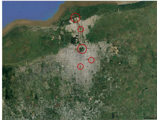
Figura 1: Microrregión Gran La Plata.