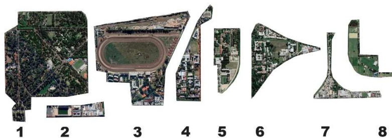
Figura 3: Áreas homogéneas (unidades de micropaisajes).

De esta manera, comenta Peries (2019), se establecen niveles de homogeneidad que determinan la subdivisión de la zona de estudio en áreas con caracteres diferenciados. El carácter de cada área es desarrollado en particular con información cuantitativa y cualitativa, donde se destacan aquellos componentes del paisaje con más relevancia que le dan carácter del paisaje.