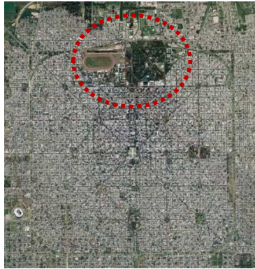
Figura 2: Aproximación al sector paseo del bosque y alrededores.

El recorte del trabajo se encuadra en un Paisaje de Atención Especial, puesto que es un elemento de identidad importante en la región. Se considera la relación entre las tres ciudades, La Plata-Berisso-Ensenada, a partir de un amplio sector que incluye grandes zonas de intercambio de flujos. El sector posee una condición particular con el paisaje circundante ya que se trata de un área de interés urbano-paisajístico, que además manifiesta ciertos conflictos físicos, ambientales y sociales con actores interjurisdiccionales del sector público y privado. A pesar de ello, expresa un gran potencial de desarrollo para la consolidación de la ciudad con su contexto regional, vinculado por la traza del eje fundacional de la ciudad de La Plata.