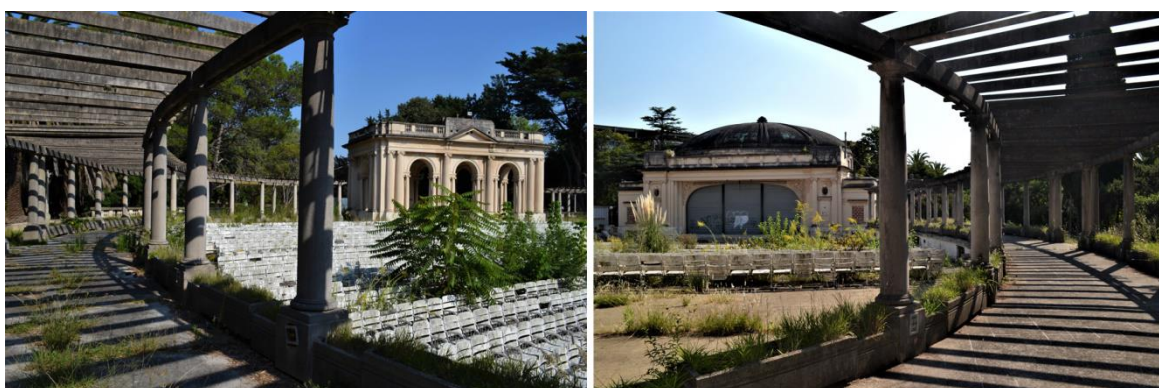
Figura 2: Imágenes peatonales del Anfiteatro Martín Fierro