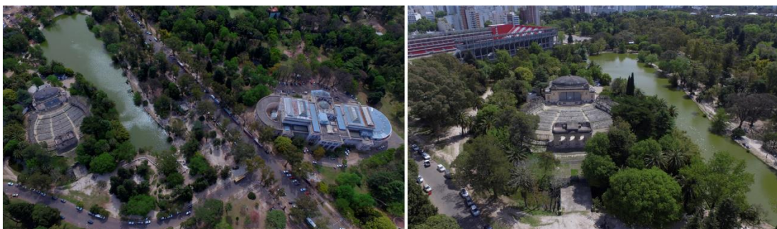
Figura 1: Implantación del Anfiteatro en el Paseo del Bosque.