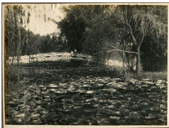
Figura 7: Jardín Japonés en el Jardín Botánico de Asunción. Ca. 1920