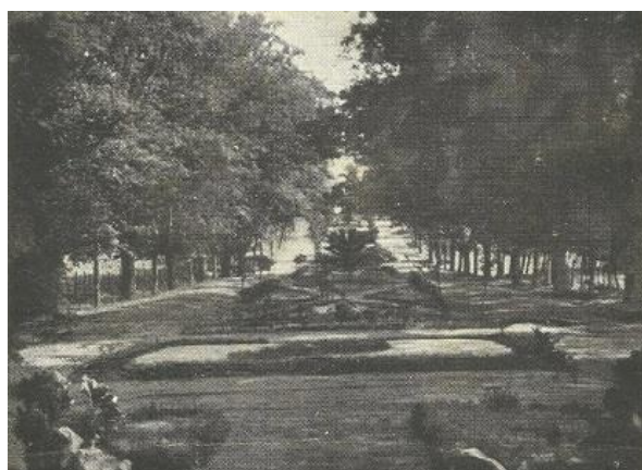
Figura 1: Jardín De La Señora. Ca. 1920

Con respecto al “Jardín de la Señora”, destacan como resultados la constatación de variación absoluta de su diseño original, que tuvo un trazado geométrico y simétrico, con porciones bien definidas basadas en formas rectangulares y triangulares y con rasgos estilísticos propios del neoclasicismo y algunos elementos románticistas. Como vestigios de aquel diseño, se encuentran aún una pequeña gruta artificial, una laguna y una balaustrada en torno a ella. El estado de conservación de este último elemento es insuficiente, presentando un aspecto ruinoso.