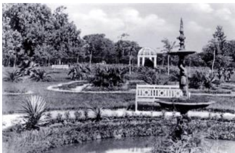
Figura 3: Jardín Kamba'i. Ca. 1920