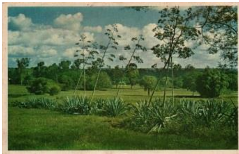
Figura 5: Praderas del Jardín Botánico de Asunción. Año 1967