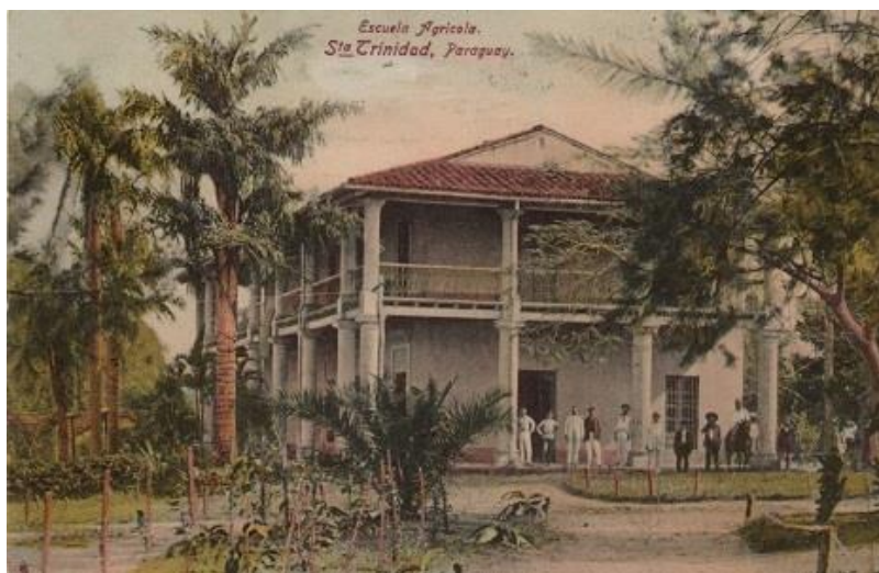
Figura 6: Casa Alta. Ca. 1900

Fuente: Tarjeta postal. Acervo Milda Rivarola