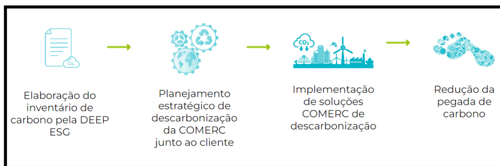
Fluxo completo da Jornada de Descarbonização

Por meio da Jornada de Descarbonização , as empresas não apenas mensuram suas emissões com maior confiabilidade e rastreabilidade, como também recebem uma curadoria estratégica para implementar soluções personalizadas de descarbonização, como consumo de energia renovável, eficiência energética, aquisição de certificados I-REC de energia renovável e créditos de carbono