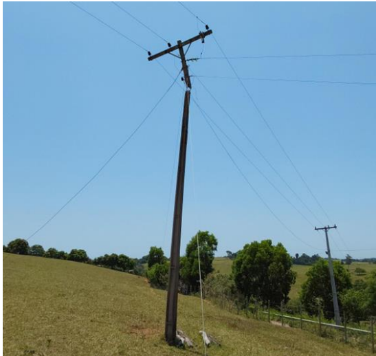
Defeito em Poste na cidade de Anchieta/ES