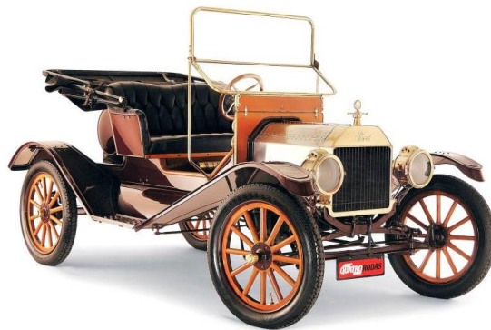
Figura 01: Modelo Ford T, Ford Bigode.

No Brasil, a Ford Motors Company , hospedou-se no centro de São Paulo, capital, onde o modelo Ford T, popularmente conhecido como Ford Bigode (figura 01), era montado. A montadora abriu suas portas em 1919, com isso foi definido que a empresa estabelecesse seu escritório permanente na cidade e na época foram investidos certa de 25 mil dólares, logo este capital aumentaria gradativamente pela demanda dos veículos. A Ford Brazil foi uma das primeiras filiais da montadora no mundo, dando sequência ao Canadá, França, Inglaterra, Irlanda e Argentina (Ford, 2019).