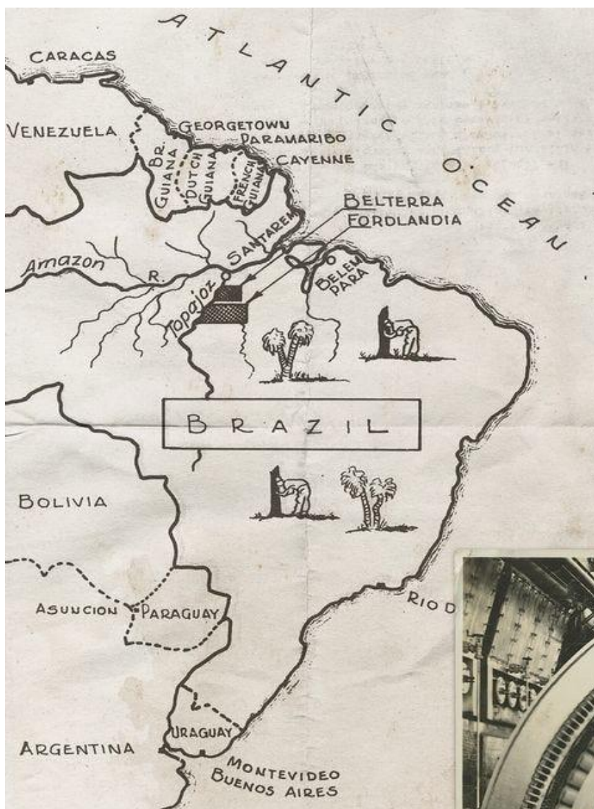
Figura 02: Mapa ilustrado da localização de Fordlândia.

Em 1928, concretizasse a possibilidade utópica fordista, começam a limpar a área de floresta, ocupando cerca de 14.568 km 2 , tendo que derrubar a vegetação na Amazônia Oriental, localizando Fordlândia no município de Aveiro (figura 02 e 03).