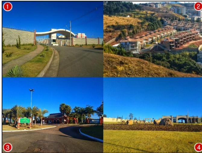
Figura 1 – Espaços residenciais fechados de médio e alto padrão, murados e cercados, equipados com sistemas de vigilância. Residencial Centreville (1), Condomínio Bosque das Araucárias (2), Residencial Campo da Cachoeira (3) e Residencial Fechado Serras Altas Golf Estate (4). Zona Oeste de Poços de Caldas.

Esse tipo de empreendimento é observado em diferentes cidades, refletindo uma tendência comum na urbanização contemporânea.