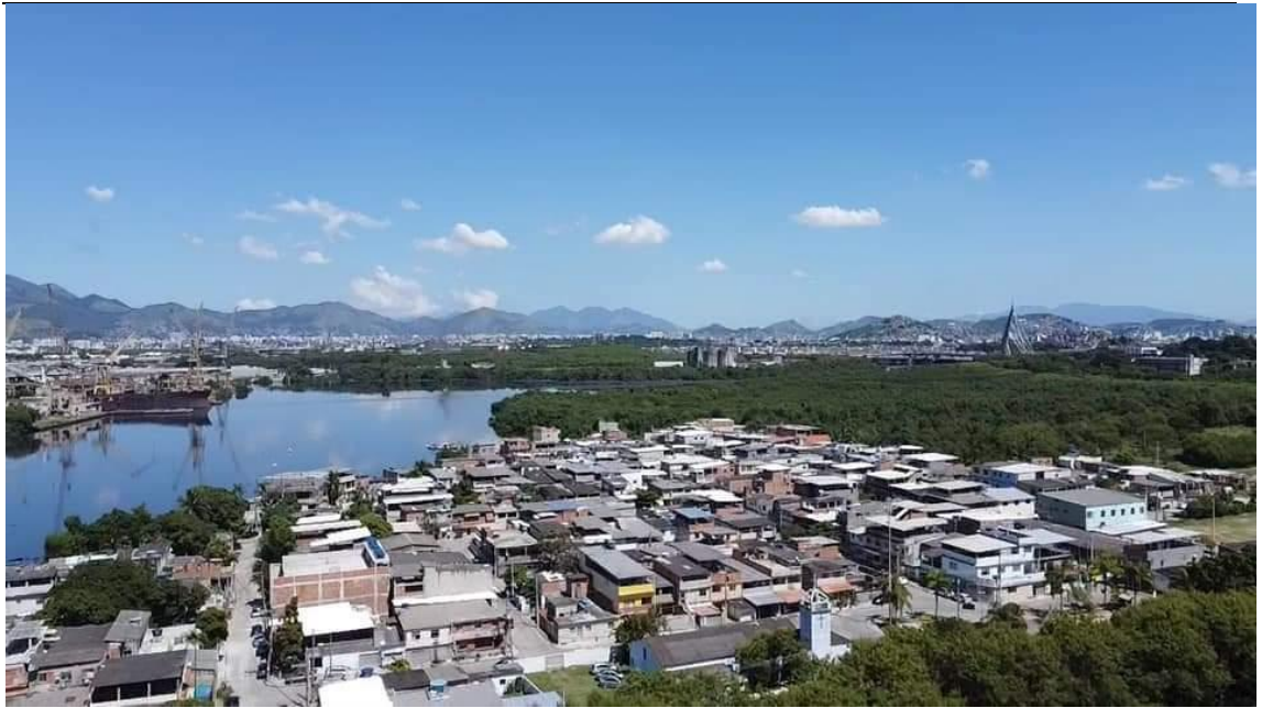
Figura 3: Visão aérea parcial da Vila Residencial, 2021