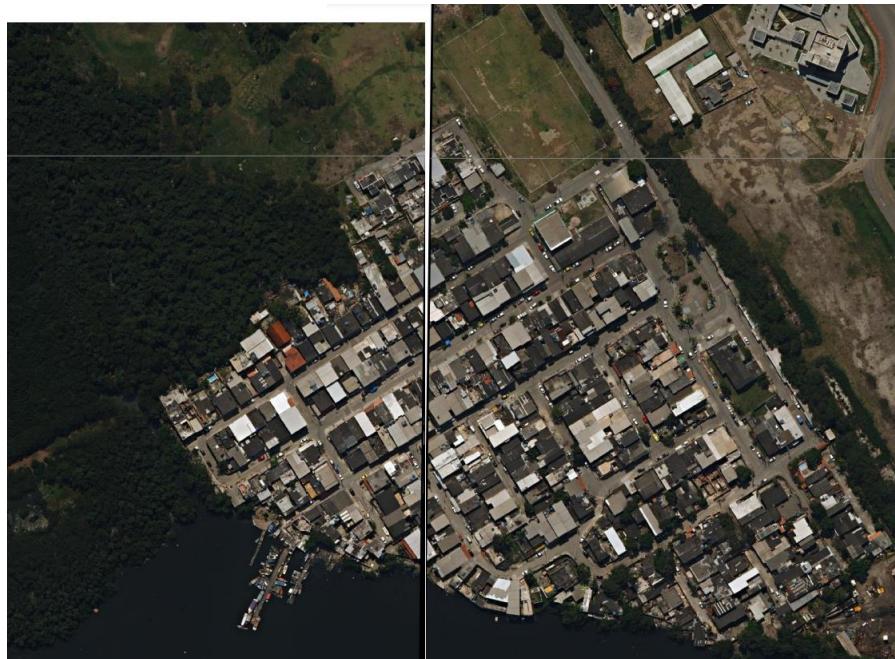
Figura 2: Montagem com as ortofotos da Vila Residencial