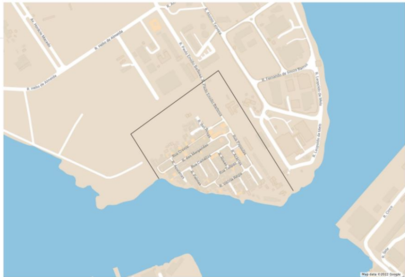
Figura 4: Delimitação da Vila Residencial

Vila Residencial da UFRJ Demarcação - Vila Residencial da UFRJ Vila Residencial da UFRJ