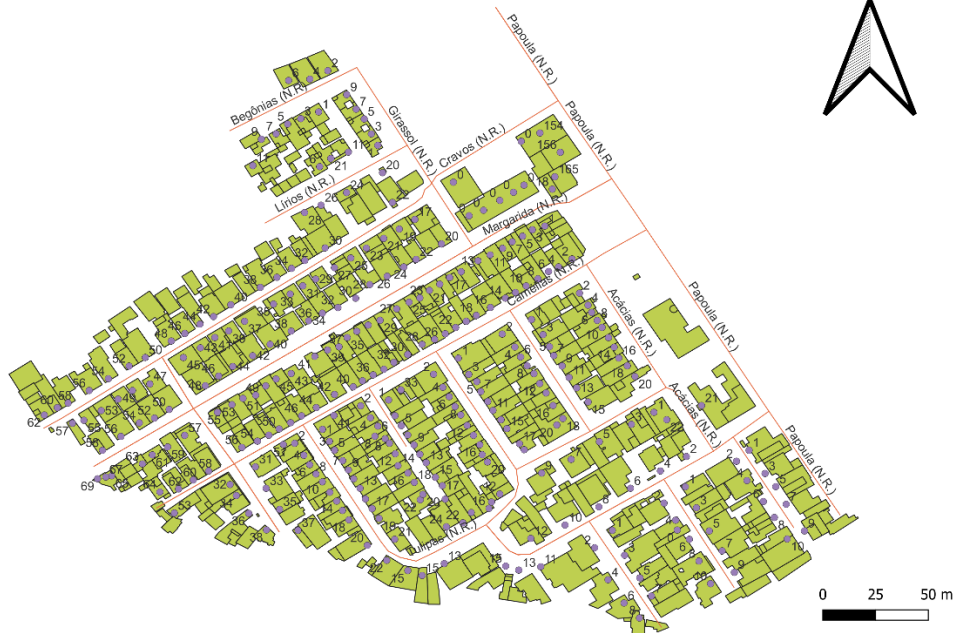
Figura 6: Carta cadastral da Vila Residencial