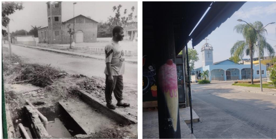
Figura 7: Refotografia da Igreja situada na Vila Residencial. c. 1980/2023

ficar restrito apenas a grandes acervos e arquivos (públicos ou privados); ele deve incluir também pequenas coleções particulares e “obscuras”, álbuns de família etc. (Rasmussen; Voth, 2001). Este parece ser o caso da memória da Vila: a maior parte de seu acervo imagético não constitui um acervo formal e nem integra as bases iconográficas oficiais. Abaixo, na figura 7, temos uma singela amostra do que pode fazer ver a Refotografia: