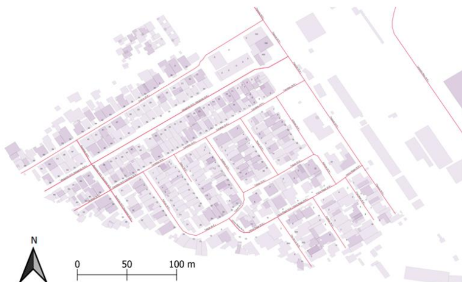
Figura 5: Carta Cadastral da Vila residencial