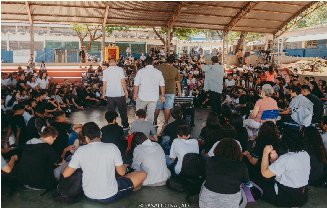
Imagem 03. Batalha do Vale realizando atividade em escola pública de Presidente Prudente em 2022.

dos padrões), falando gírias e usando bonés. Esse contato dos jovens da Batalha do Vale com os adolescentes "mais novos" se torna um momento de aprendizagem, pois ao verem pessoas próximas a eles, que falam a mesma linguagem, tocarem em assuntos e promoverem debates a respeito da importância dos estudos e do conhecimento realmente estimula os alunos a se aproximarem e levarem mais a sério os estudos. Sabemos, no entanto, que uma aprendizagem significativa não acontece a curto prazo, porém não podemos deixar de destacar que as investidas dos coletivos de Hip Hop para dentro das escolas são uma conexão do ambiente escolar com os saberes que ocorrem nas ruas, como mostramos aqui. Não é de hoje que trabalhos científicos destacam o potencial do Hip Hop e seus elementos artísticos em abordar temáticas sociais previstas pelo currículo escolar (JOVINO, 1999; NEVES, 1999). O que tratamos aqui, é mais uma tentativa de um coletivo formado por jovens periféricos em atingir a trajetória de vida de adolescentes que podem estar sem inspiração para elaborar projetos pessoais através da cultura Hip Hop, criando pontes entre os conhecimentos que circulam nas ruas e os saberes que são propostos na escola.