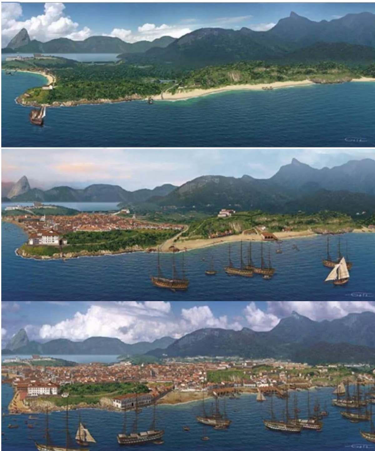
Figura 1: Rio de Janeiro em 1608, 1710 e 1839. 1

No decorrer do século XIX, a cidade do Rio de Janeiro passou capital da colônia para sede da corte, depois de sede do império e por fim, capital da república. É imprescindível