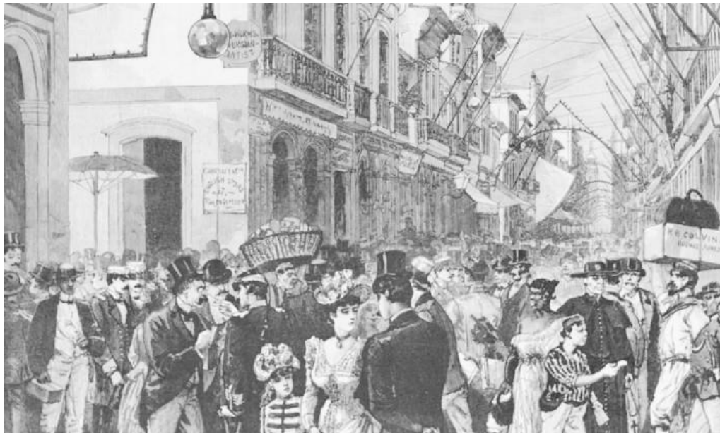
Figura 3: Cotidiano da Rua do Ouvidor no século XIX. 3

Ao ser retomada a discussão sobre a formulação de um novo centro para uma nova cidade, é elencado as bases de pensamento que originaram as intervenções sócioespaciais no Rio de Janeiro. Vale ressaltar que essas intervenções tinham como objetivo tornar a cidade salubre e reordenar o crescimento desordenado, proveniente do expressivo crescimento populacional e das ruas estreitas existentes desde o tempo colonial (BENCHIMOL, 1992). O novo centro viria a representar a imagem moderna para a capital do país, com a solução dos paradoxos criados com as profundas mudanças ao tornar uma cidade colonial na sede da corte portuguesa, além de comungar com o exemplo das reformas urbanas de Paris no século XIX. Desta forma, seria possível formular uma nova imagem para o jovem país e na efetiva mudança das práticas e costumes que eram cotidianos até então (ABREU, 1997).