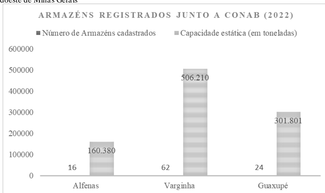
Tabela 6: Capacidade dos armazéns registrados junto a Conab das cidades do agronegócio da mesorregião Sul/Sudoeste de Minas Gerais

Quanto às infraestruturas fixas que atravessam o território, a presença de sistemas de armazenamento ajuda a identificar os municípios que atuam como centros de recepção e expedição de grãos. Isso está ilustrado na Tabela 6 a seguir.