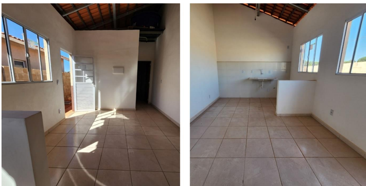
Figura 06 – Habitações contruídas pela Suzano e Entrada Jardim dos Estados