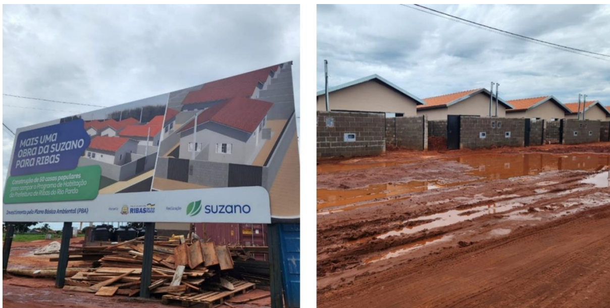
Figura 05 – Habitações contruídas pela Suzano e Entrada Jardim dos Estados

Esse projeto surge como resposta a urgência da questão habitacional, no qual a população vem reivindicando do Estado a execução de políticas habitacionais. Entretanto, essa política da prefeitura, não impede o capital de integrar e atuar enquanto um agente produtor do espaço urbano através da habitação e isso ocorre não apenas através do mercado imobiliário, como aponta Almeida (2011).