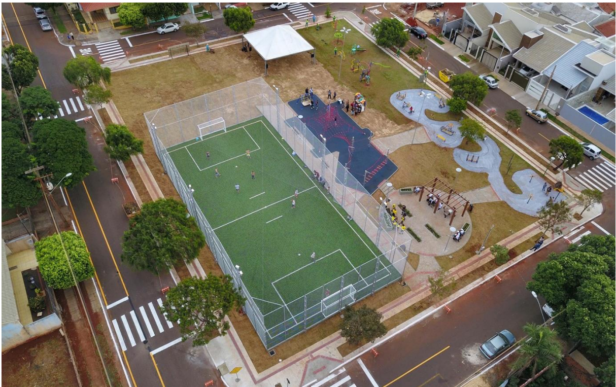
Figura 1 - Primeira unidade do PMC implantada no município de Maringá, localizada no Jardim Novo Oásis