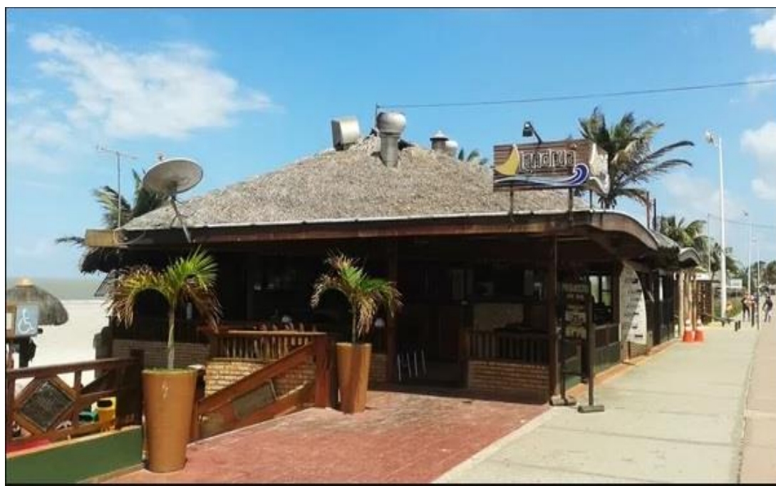
Figura 1 – Barraca na Avenida Litorânea.

Ainda na década de 1990, por meio da Prefeitura Municipal de São Luís, também é iniciado um projeto para a padronização de barracas nas praias localizadas na Avenida Litorânea, que até este momento, já existiam, mas de forma independente. O intuito seria padronizar a rede comercial atuante no local, visando fornecer melhor infraestrutura aos visitantes, realocar barracas que se encontravam nas áreas de dunas e alavancar o turismo em São Luís (Silva Júnior, 2007). A Figura 1 demonstra um modelo de barraca atual no local.