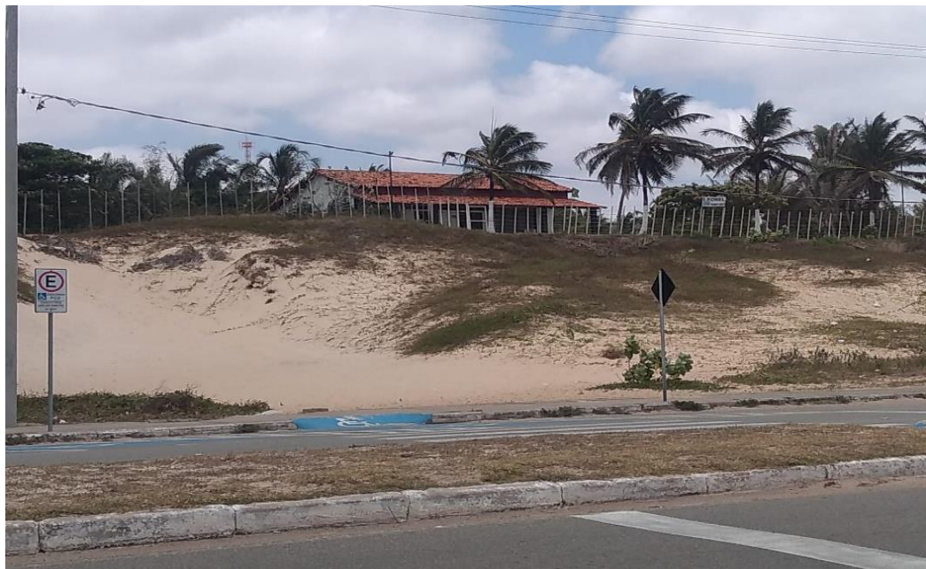
Figura 2 – Residência em dunas na Avenida Litorânea.

Porém, percebe-se que até os dias atuais ainda existem algumas famílias que resistem a este processo, e continuam a residir sob as dunas presentes em toda a extensão da Avenida Litorânea. A Figura 2 expressa uma exemplificação da ocupação da área de dunas presente no local.