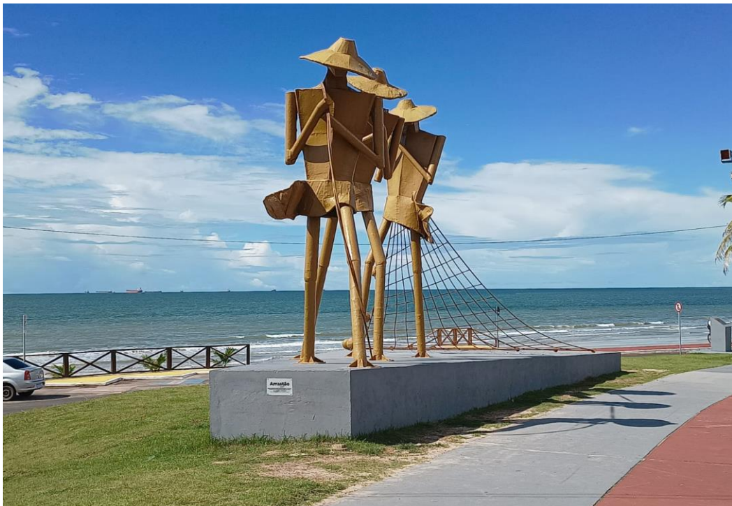
Figura 6 – Monumento ‘três pescadores’ na Avenida Litorânea.

Outro fator que está relacionado ao viés social, é a existência de infraestruturas como praças, mirante, parque de diversões e espaços de convivência ao longo da Avenida Litorânea, proporcionando aos visitantes usos do espaço além do lazer tradicional de sol e mar. O fator cultural também pode ser identificado, através de elementos presentes na avenida que expressam hábitos culturais de São Luís, como por exemplo, o monumento dos ‘três pescadores’, que exemplifica uma prática comum no litoral maranhense, a atividade pesqueira (Figura 6).