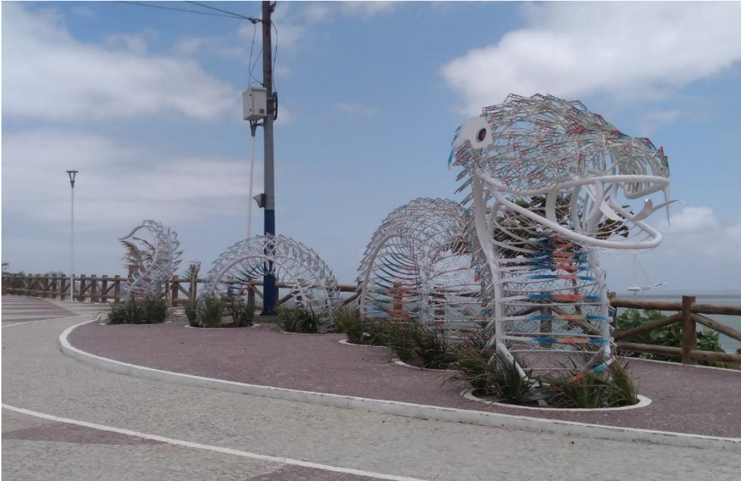
Figura 7 – Escultura ‘Serpente Encantada’ no Mirante da Avenida Litorânea