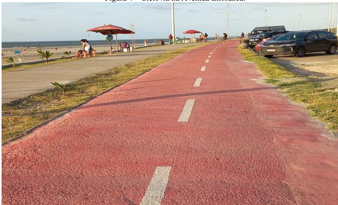
Figura 4 – Ciclovia na Avenida Litorânea.