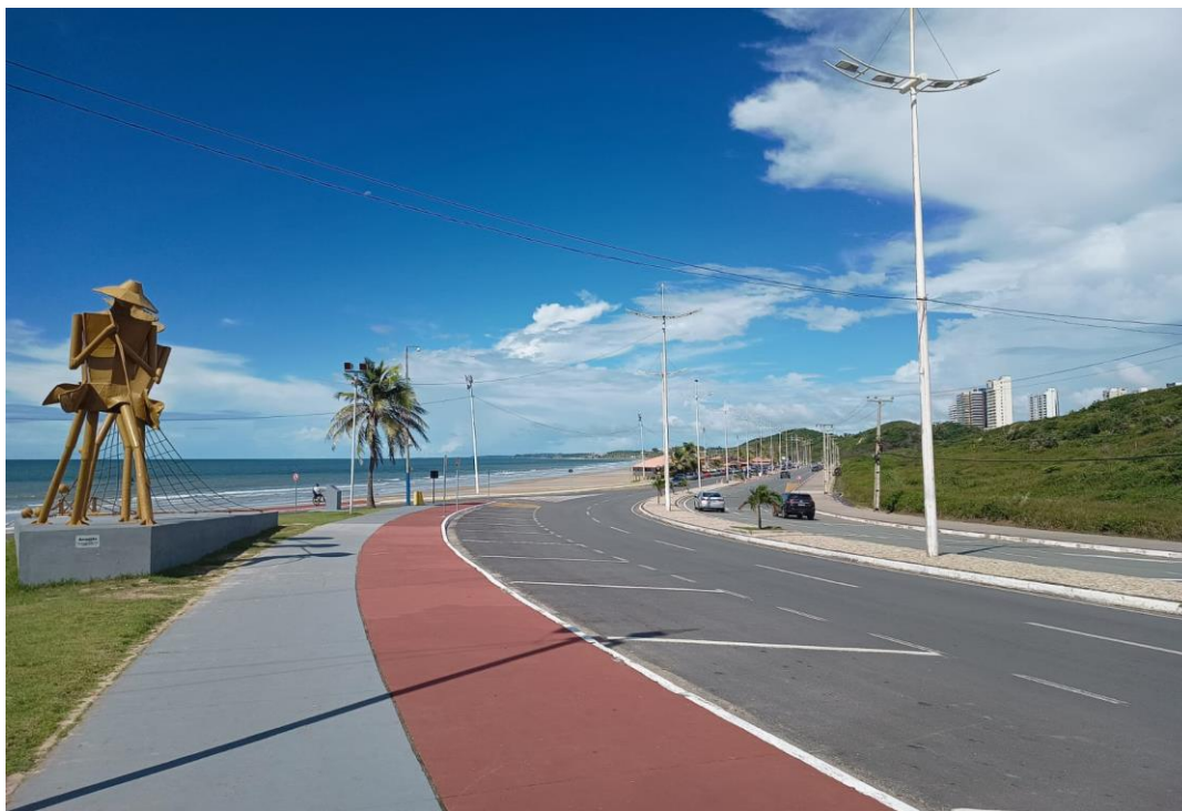
Figura 5 – Avenida Litorânea.