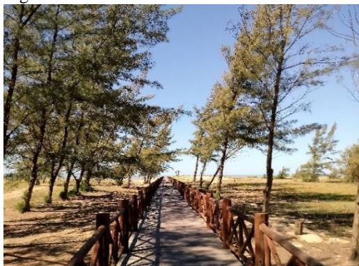
Acesso à praia de Grussaí.