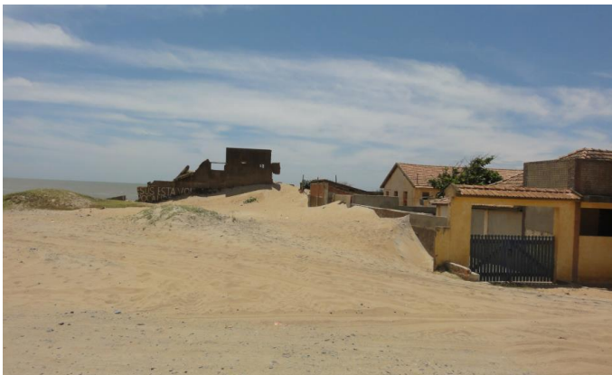
Avanço das dunas sobre residências ainda habitadas.