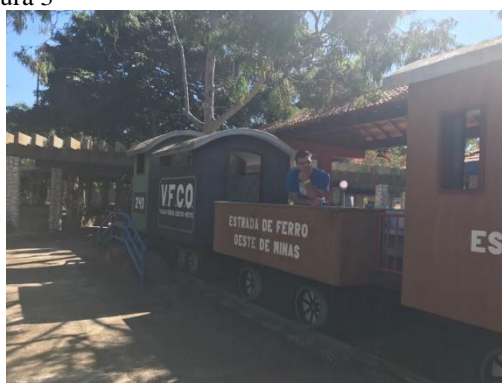
Maria-fumaça no SESC Mineiro de Grussaí.

O investimento da prefeitura local em parceria com empresas privadas, a partir da década de 2000, principalmente com diversos shows de artistas renomados nacionalmente, eleva o turismo neste município, porém, em contrapartida, uma outra realidade é vista em Atafona.