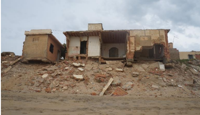
Casa destruída pelo avanço do mar.