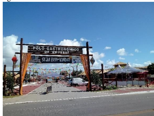
Polo Gastronômico de Grussaí.