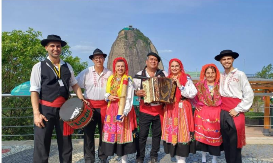
Figura 6: Divulgação evento “Caminhos para Portugal, uma Passagem inesquecível”. Disponível em: https://cabofrio.rj.gov.br/polo-gastronomico-da-passagem-em-cabo-frio-promove-caminhos-para-portugal-neste-fim-de-semana/

25/10/2023 | Secretaria Adjunta de Comunicação | Notícias, Turismo