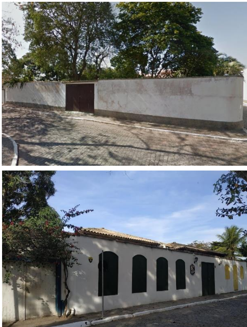
Figura 4: Edificação no ano de 2011 e 2023, respectivamente.

Podemos citar como exemplo a edificação localizada na esquina rua Maestro Clodomiro Guimarães Oliveira com a rua Furtado (figura 4). Nota-se inicialmente apenas um muro com abertura de garagem, que ao longo dos anos foi se transformando. Na modificação, percebe-se a abertura de portas e janelas no formato de arco abatido que remetem ao período colonial.