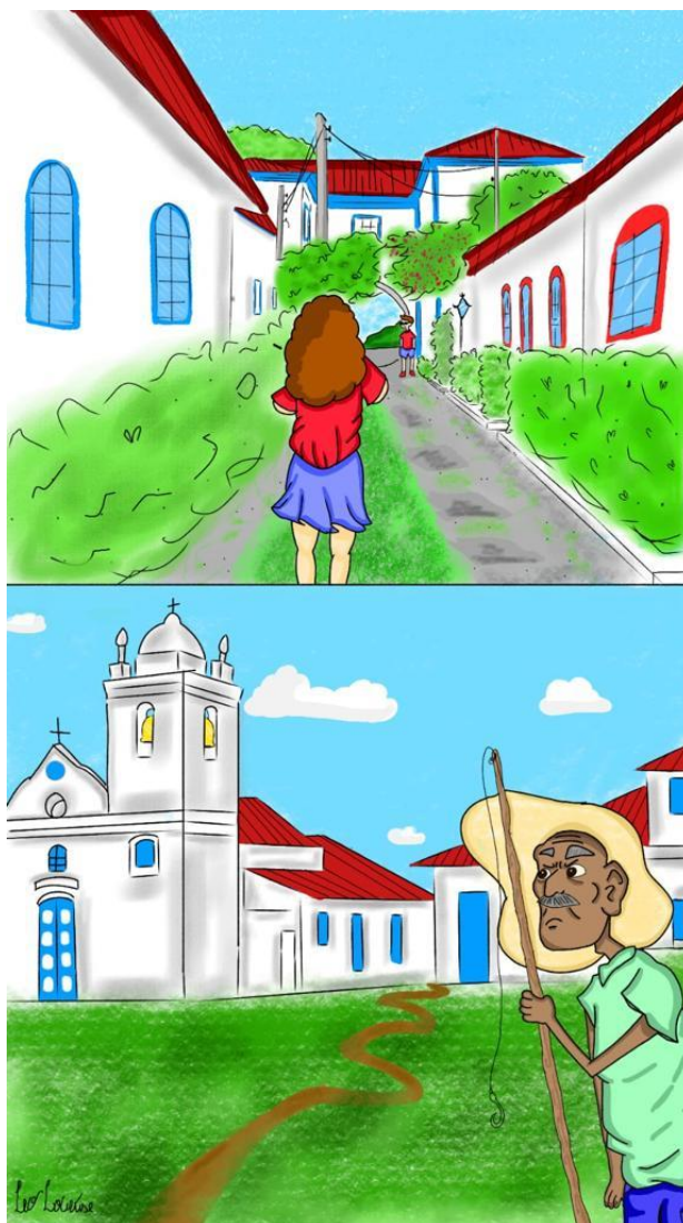
Figura 7: Croqui do bairro da Passagem.

Esse tipo de representação enriquece e traz mais informações sobre os locais de análise. Apesar desses benefícios, as ilustrações muitas vezes são colocadas em categorias como meros esboços que não merecem atenção, apesar do grande potencial de contribuição e de complementação à leitura de determinado espaço.