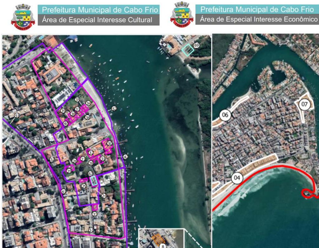
Figura 3: Mapas anexos no plano diretor de Cabo Frio.

O turismo cultural, conjugado aos atrativos gastronômicos do local, se tornou pujante no bairro da Passagem. No atual Plano Diretor da cidade o bairro figura tanto nos mapas de interesse cultural, quanto nos de interesse turístico (figura 3):