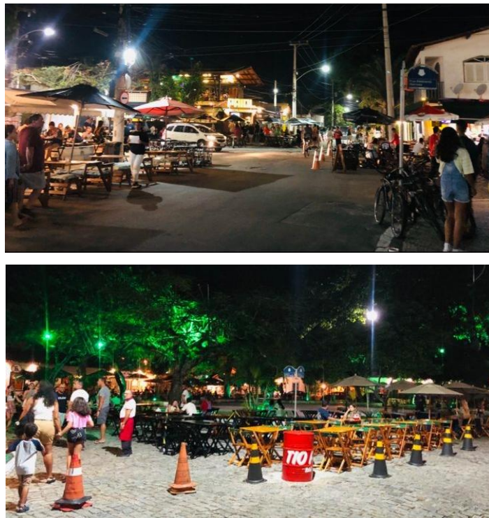
Figura 2: Fotografias do barro da Passagem.

Harvey (2014) destaca que são observadas a criação “marcas” utilizadas na venda do espaço que se insere na indústria turística. Harvey (2013) afirma que o sucesso da criação das marcas de cidades pode requerer a expulsão ou erradicação de todas as pessoas ou coisas que não sejam adequadas a marca e que “a mercantilização e comercialização de tudo constitui, afinal, uma das marcas características de nossa época”. Atualmente é área é rotulada Polo Gastronômico da Passagem 2 e verifica-se a instalação de diversos restaurantes e bares que ocupam principalmente o entorno da praça e as ruas adjacentes (figura 2).