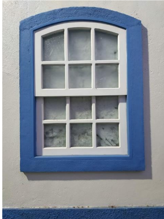
Figura 5: Esquadria utilizada na cenarização do espaço.

Outros exemplos são encontrados no local. Fachadas que anteriormente eram lisas e sem abertura, que são modificadas e recebem portas e janelas, principalmente na cor azul, ao estilo colonial. Algumas delas nem sequer constituem realmente vão, são esquadrias implantadas para a cenarização do espaço, como exemplificado em fotografia retirada de uma dessas edificações (figura 5).