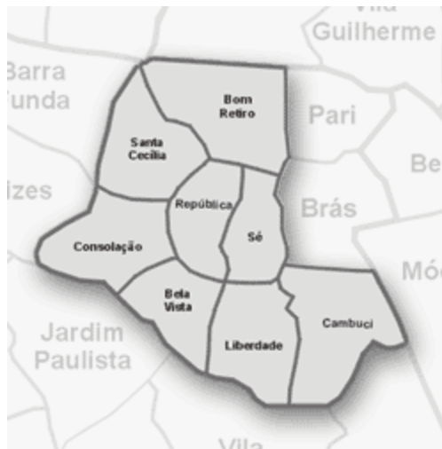
Figura 3 – No mapa o Distrito da Sé com os Bairros da Sé, República, Bela Vista e Liberdade.

De acordo com o levantamento feito, os bairros que mais se destacam como redutos de resgate de memória negra são: Sé, República, Liberdade e Bela Vista. (Figura 3) Os locais mais associados à memória negra, de acordo com os roteiros pesquisados, são: Igreja Nossa Senhora dos Homens Pretos (Praça Antônio Prado), Largo do Paissandu, Largo da Memória e Obelisco do Piques, o Bairro da Liberdade e parte da Sé (com a Praça da Sé, Largo 7 de setembro e Praça da Liberdade- Japão, antigo Largo da Forca com Capela e Cemitério de Nossa Senhora dos Aflitos e a Igreja da Santa Cruz das Almas dos Enforcados), além do Bairro da Bela Vista (Bixiga).