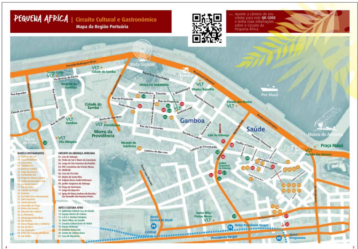
Figura 2 – Mapa do guia sobre a Pequena África

A Pedra do Sal é uma pedra com uma escada esculpida, que nos séculos XVIII e XIX era usada para desembarque de sal. Hoje é uma das entradas do Morro da Conceição. Com o fim da escravidão, seus arredores passaram a ser habitados pela população negra que trabalhava na região. O local é considerado um dos berços do samba e sede de um dos primeiros terreiros de candomblé do país. (ABREU, 2013). Hoje são famosas as rodas de samba que acontecem no lugar durante a semana, após o expediente de trabalho.