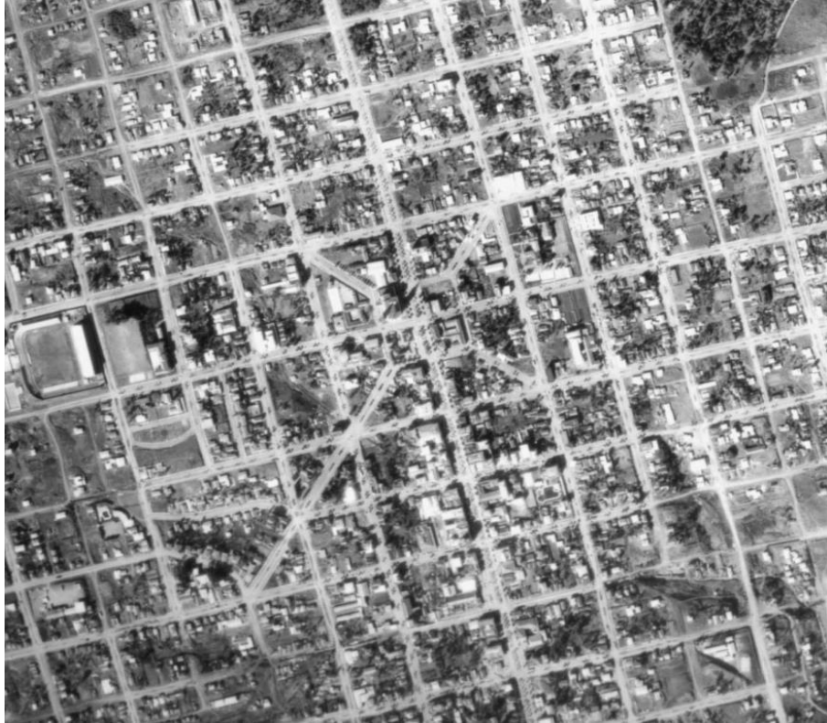
Imagem 1- Foto aérea de 1979, área central de Chapecó