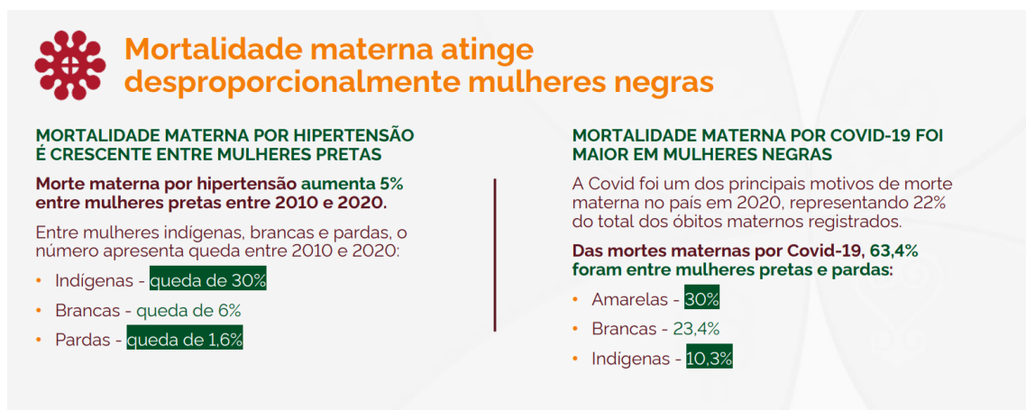
Figura 3. Perfil epidemiológico materno-infantil