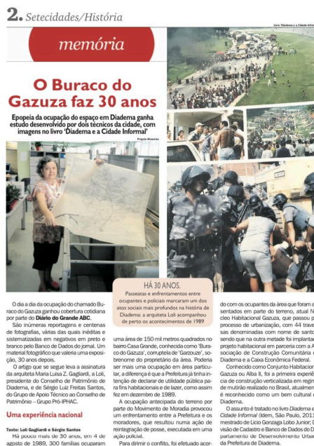
Figura 2 – Reportagem sobre os 30 anos da ocupação do Buraco do Gazuza. 4

fotografias de passeatas e outros enfrentamentos entre os moradores do Buraco do Gazuza e os policiais.