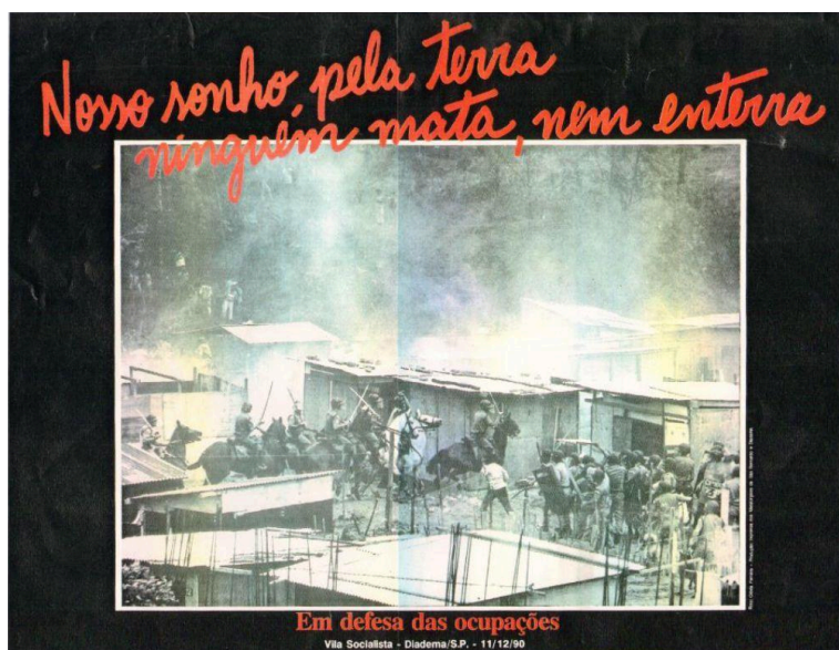
Figura 4 - Imagem símbolo da Associação Oeste de Diadema

A imagem símbolo da Associação Oeste de Diadema (figura 4) é um símbolo de resistência, memória e solidariedade. Ela é constituída por uma fotografia do dia da reintegração de posse que ocorreu na ocupação localizada no Jardim Inamar. A presença dos policiais e dos sem-tetos na fotografia evidencia o conflito e as violências enfrentadas pelos movimentos socioterritoriais. A frase “nosso sonho pela terra ninguém mata, nem enterra” carrega um significativo peso político – e também sentimental–, que ressalta a determinação e resistência dos sem-tetos em sua luta pela conquista da terra. A perda de dois companheiros de luta nesse trágico dia é uma lembrança dolorosa da violência e opressão que muitas comunidades marginalizadas enfrentam diariamente.