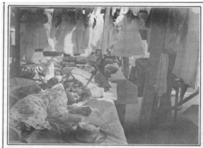
Imagem 03: Criança dormindo a luz do dia em cima de tabuleiro de roupa durante a Feira Livre de Duque de Caxias, em agosto de 1984. Disponível em: Revista Caxias Magazine

descartável da sociedade, e a informalidade é o caminho que esses indivíduos seguem para obter de forma honesta e digna o pão de cada dia.