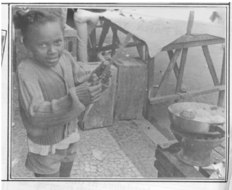
Imagem 02: Criança na calçada ao lado de frigideira e tabuleiros de madeira na feira de Caxias, em agosto de 1984.

por ser ao ar livre, isto intensifica e o espaço ganha ordenamento, hierarquia e critério.