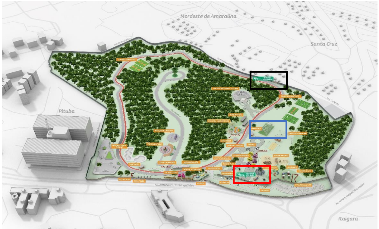
Figura 2 – Croqui do Parque da Cidade Joventino Silva na Bahia dispondo do informativo da presença das áreas para lazer. Salvador – BA, 2024.

Entrada da Santa Cruz Arco de ferro Entrada do Itaigara