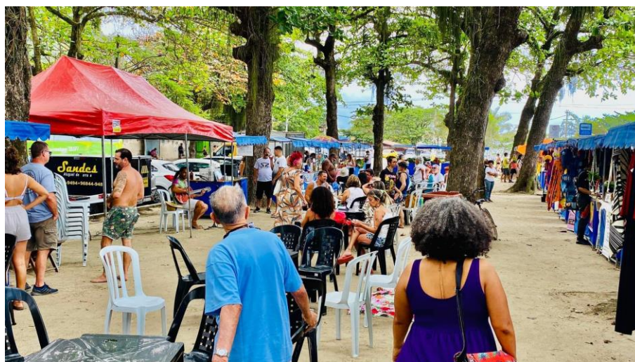
Figura 1: Feira de Economia Solidária de Itaipu