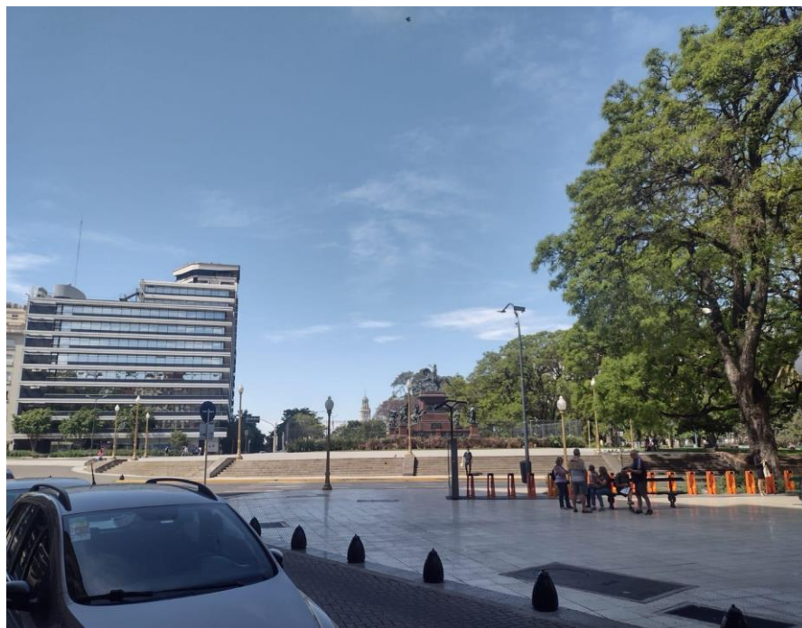
FIGURA 1 - A modernização da cidade e as praças como instrumentais de áreas verdes - Cidade Autônoma de Buenos Aires (Argentina).

Fonte: Autores. Trabalho de campo realizado na Cidade Autônoma de Buenos Aires, no bairro de Retiro (novembro de 2023) 6 .