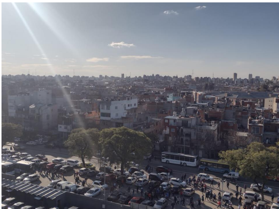
Figura 3 - Villa 1 - 11 - 14 - Cidade Autônoma de Buenos Aires.

Fonte: Autores. Trabalho de campo realizado na Cidade Autônoma de Buenos Aires, no bairro Bajo Flores (novembro de 2023).