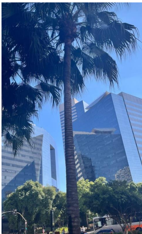
Figura 4 - Região da Faria - São Paulo (SP)

Fonte: Autores. Trabalho de campo realizado na cidade de São Paulo (SP), no bairro do Itaim Bibi (janeiro de 2024).