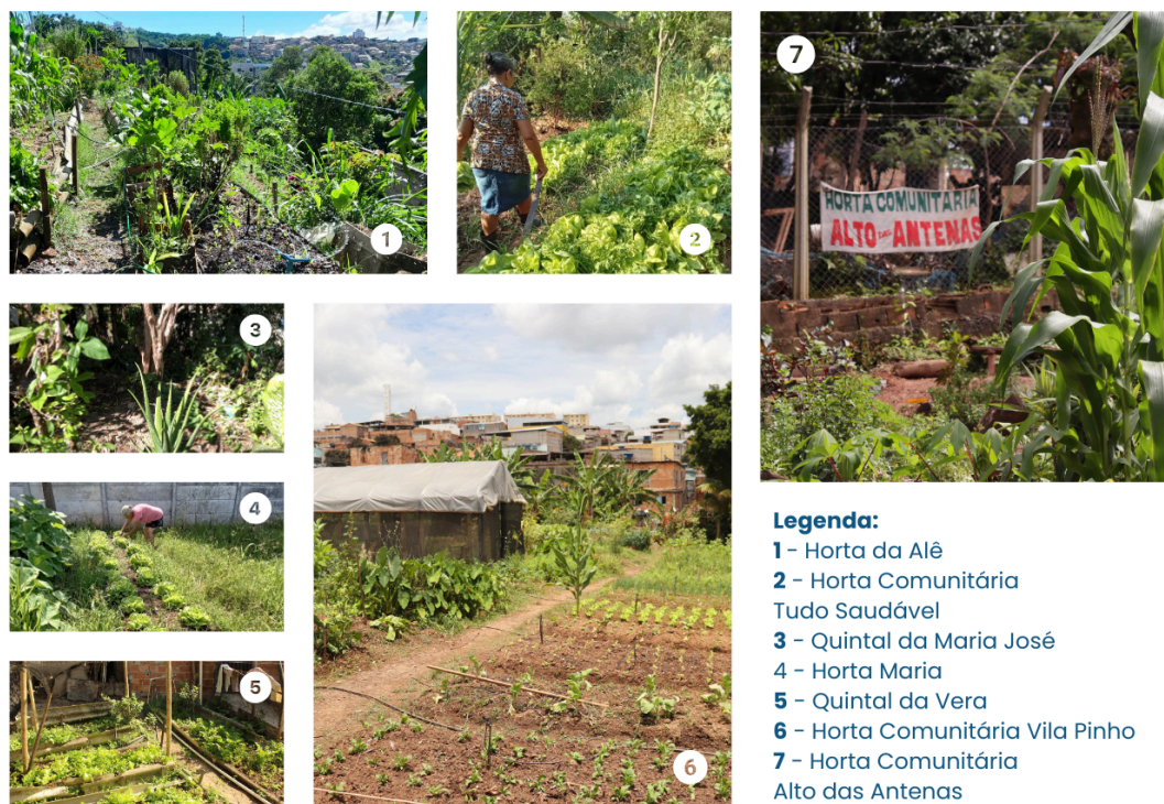
Figura 2: Quintais e unidades produtivas acompanhadas (acervo das autoras, 2024).

Ao considerar o contexto de agricultoras urbanas de Belo Horizonte, majoritariamente mais velhas e negras, ressalta-se que elas produzem em variados tipos de espaços, sendo os mais significativos os quintais de suas residências, as hortas comunitárias, os espaços públicos e remanescentes de intervenções urbanas, como também as Unidades Produtivas Coletivas Comunitárias (UPs) em bairros periféricos, vilas e favelas em Belo Horizonte (Figura 2).