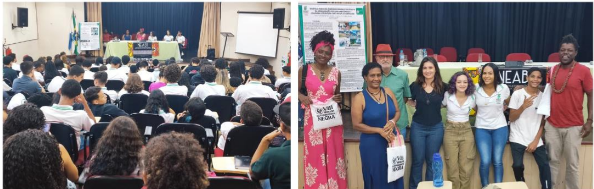
Figura 5: Mesa "A classe e a cor do direito à cidade: lutas e conquistas coletivas", realizada na VIII Semana da Consciência Negra o IFRJ Campus Pinheiral.