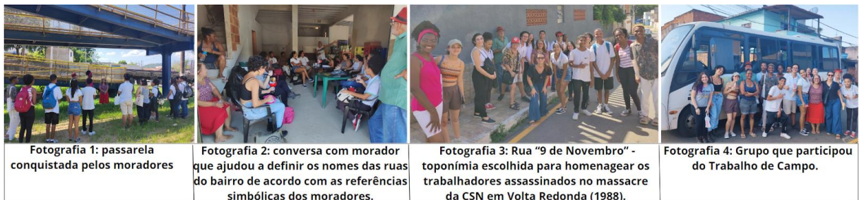
Fotografia 1: passarela conquistada pelos moradores