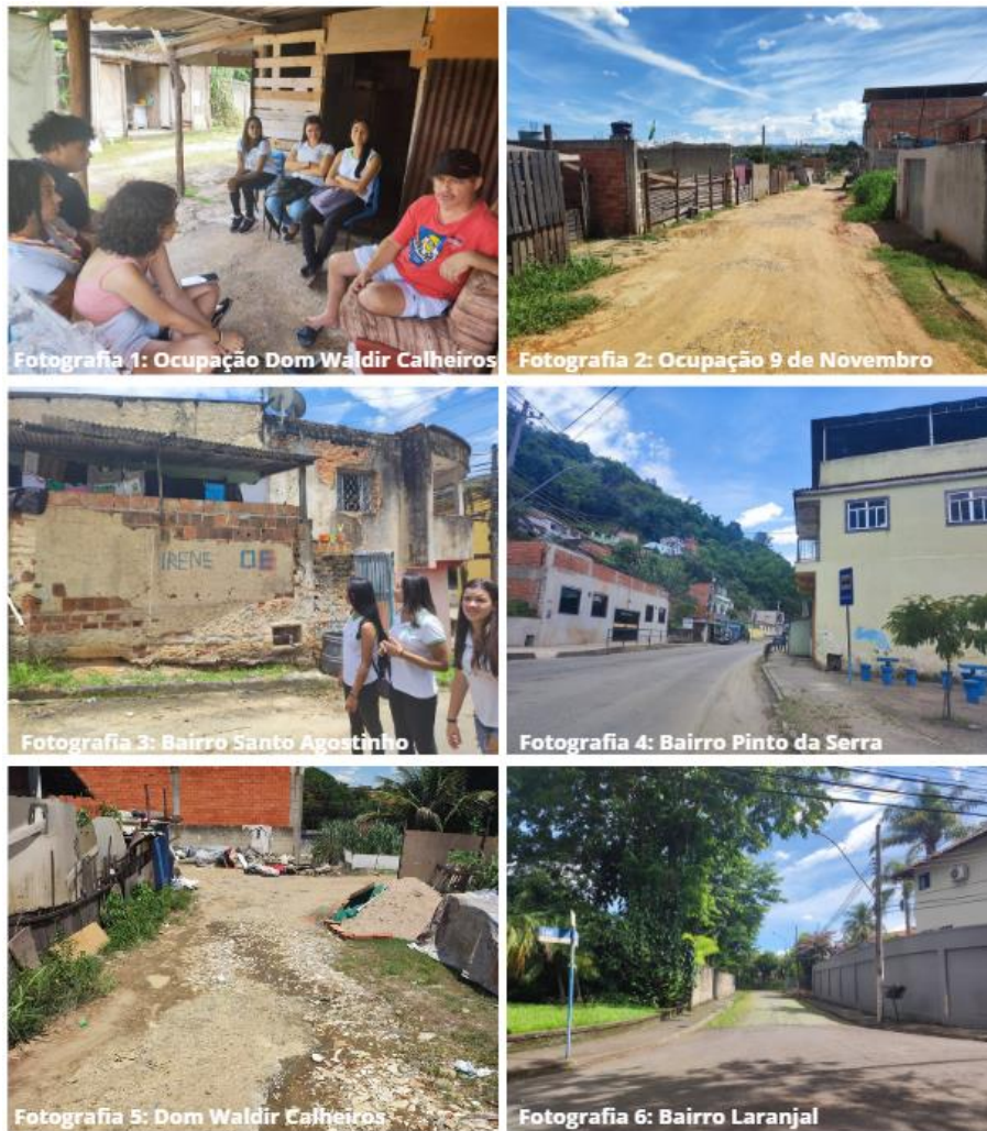
Figura 3 - Trabalho de campo realizado no dia 13/01/2023 em Volta Redonda (RJ).

conquista de direitos básicos, e como são cruciais as políticas públicas socialmente orientadas. Também observaram como a cidade é desigual em termos da oferta de serviços e equipamentos públicos, além de ofertar aos cidadãos diferentes condições ambientais (figura 3).