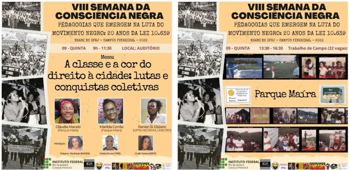
Figura 4: Material de divulgação das atividades propostas pela pesquisa na VIII Semana da Consciência Negra do IFRJ Campus Pinheiral (2023).