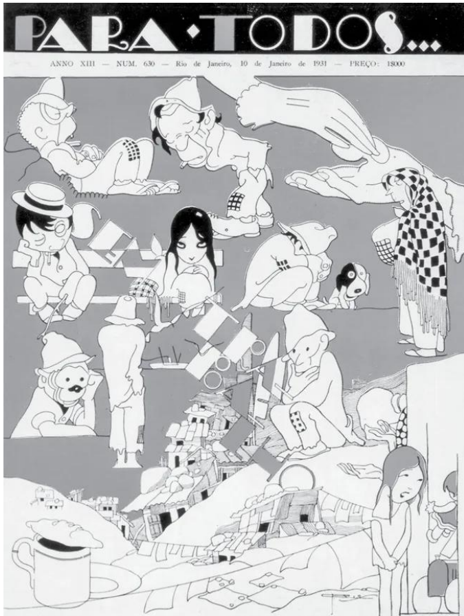
Imagem 1: Charge sobre a favela