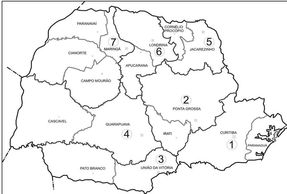
Figura 01 - Regiões e sub-regiões de planejamentos, polos e subpolos regionais