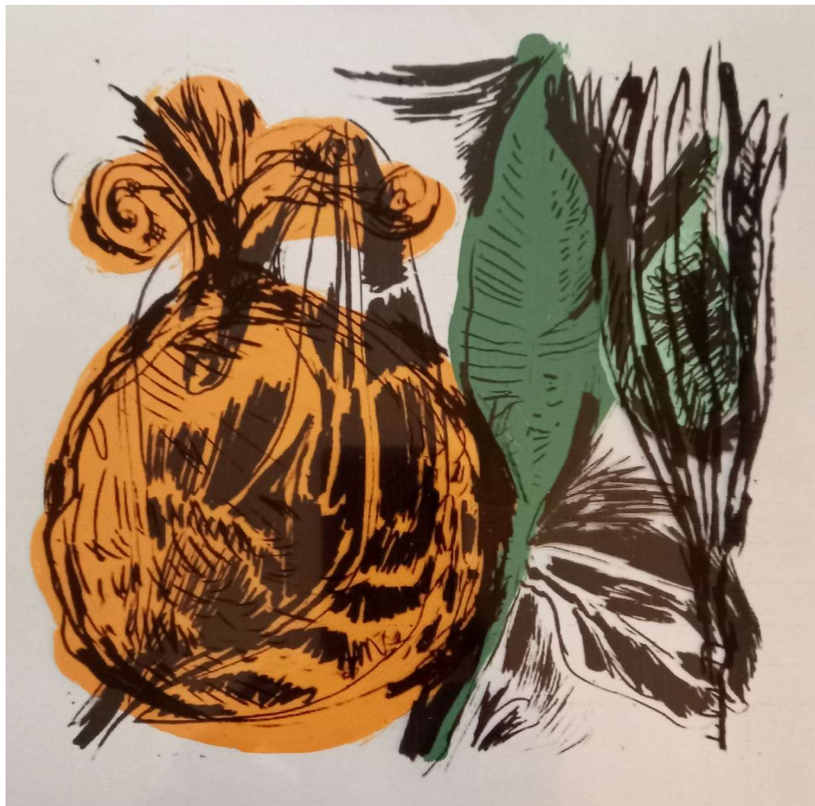
Hélio de Lima Série: Pequenos arranjos – desenhos impressos Ano: 2024 Técnica/linguagem/materiais: Impressão digital e acrílica sobre acetato Dimensões: 21cmx 21cm